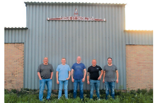
't Nije bestuur fan IJsclub St. Jacob

Hoe dan ok, fier jaar foor het 100-jarig bestaan fan 'e klup is d'r nij elan. Kers op 'e taart sou weze dat wij in 2028 'n winter krije die't maakt dat de iisbaan praktyk de hele winter open blive kin!