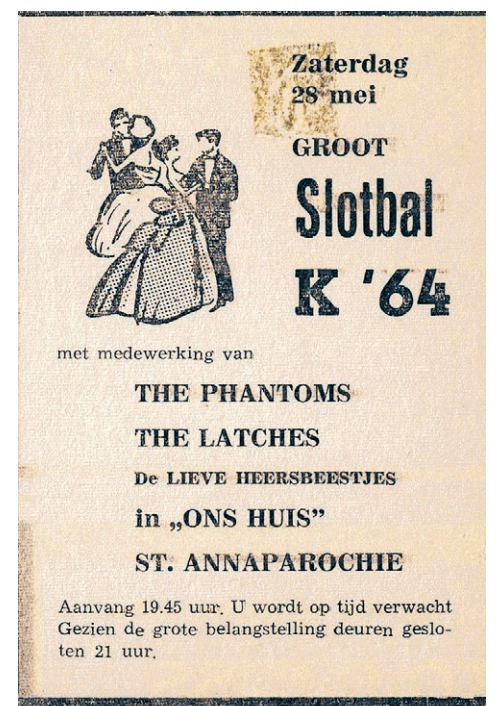
Slotbal op 28 mei 1966